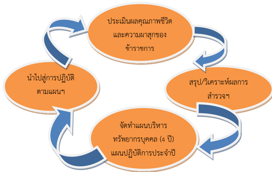
รูปที่ 5.1 ขั้นตอนการทบทวนแผนพัฒนาทรัพยากรบุคคล

ตารางที่ 5.1 ผลสำรวจคุณภาพชีวิตและความผาสุกของข้าราชการจังหวัดนครพนม เปรียบเทียบ 2555 กับ 2554