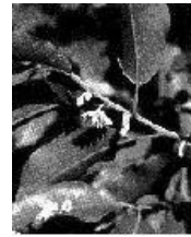
ต้นพิกุล