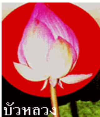
ดอกบัวหลวง