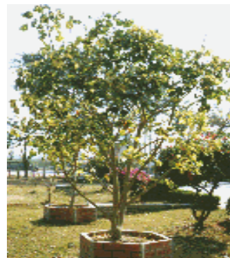
ต้นปาริชาติ